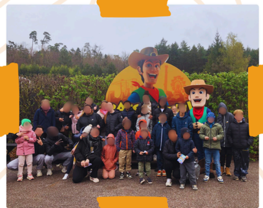
Week-end dans les Vosges pour les jeunes de la MECS de Foug

Un week-end riche en souvenirs , en partage et en bonne humeur . Les enfants peuvent être fiers d'eux !